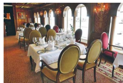
Tre olika restauranger finns ombord på fartyget.