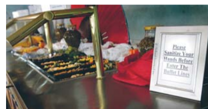
Innan man huggar in på de stora bufféerna blir man med hjälp av små skyltar tillsagd att tvätta händerna.