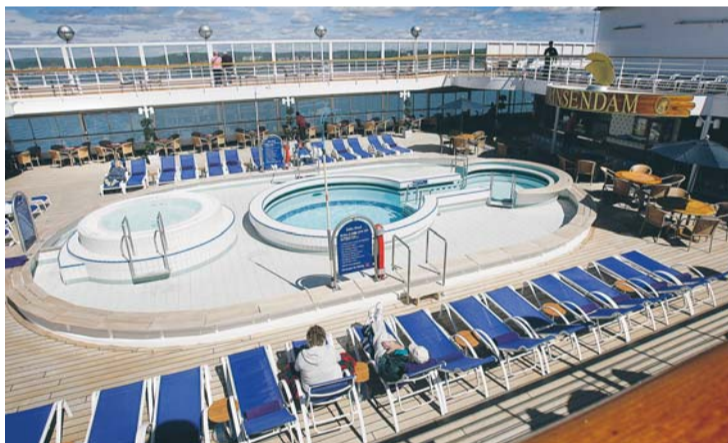
När vädret tillåter passar många på att ta ett dopp i poolerna.