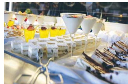
Maten är av högsta kvalitet och ett stort och varierat utbud finns att välja mellan.