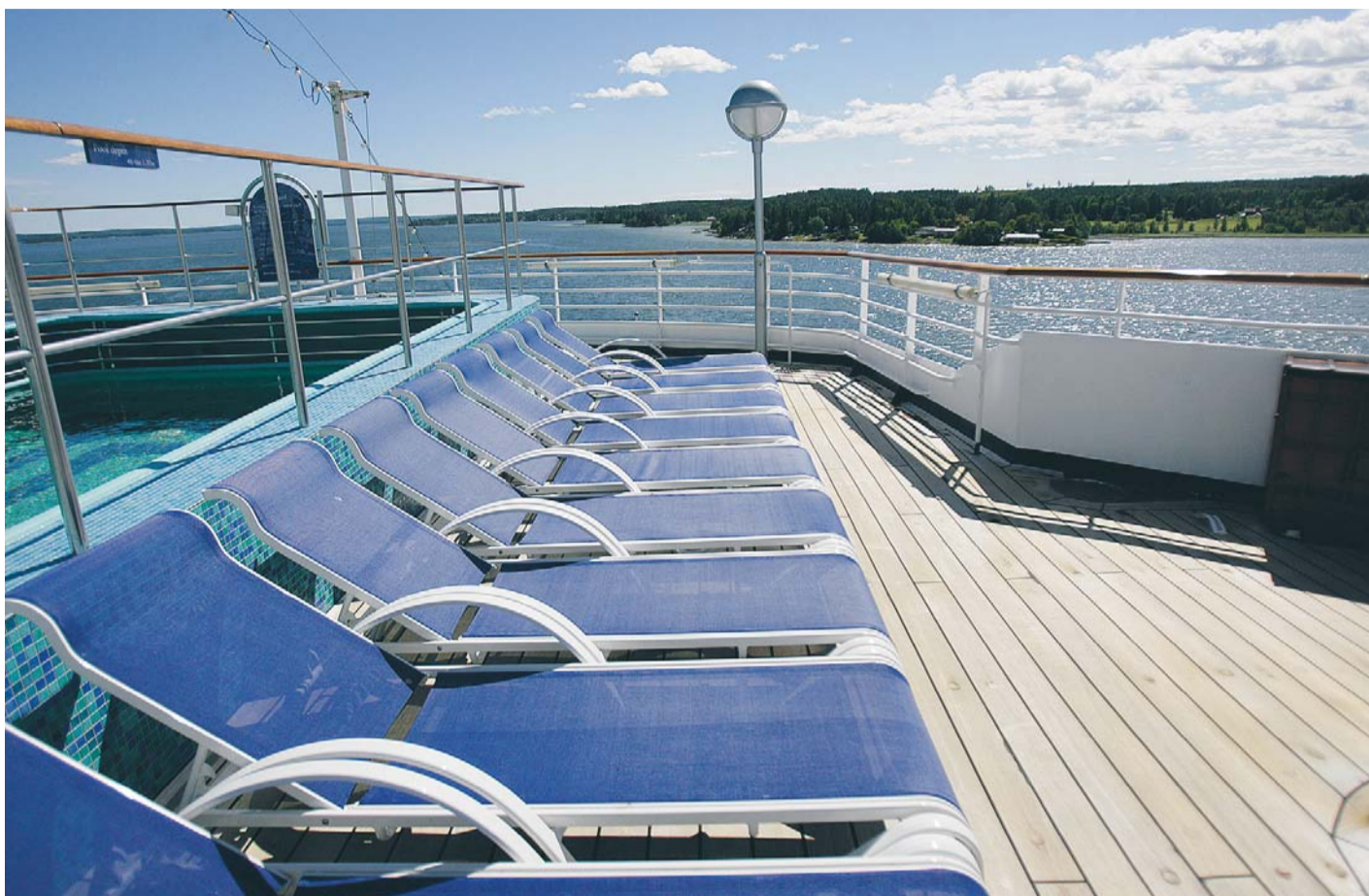
I dag är solstolarna tomma, många av passagerarna aktiverar sig genom andra saker.